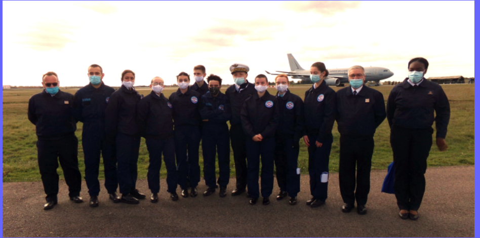
Les équipiers de l'escadrille air jeunesse avec le général directeur du CESA (centre d'études stratégiques aérospatiales)

Les équipiers de l'escadrille air jeunesse ont participé le jeudi 15 octobre 2020 à la journée organisée sur la base aérienne 105 au profit de l'Institut des hautes études de Défense nationale. Durant cette journée, une exposition statique et des démonstrations dynamiques se sont déroulées afin d'exposer les capacités et les missions de l'Armée de l'air et de l'espace. Des stagiaires de l'École de guerre, des militaires français et alliés ainsi que certaines personnalités politiques sont venus observer ces démonstrations. Ce fut donc l'occasion pour nous, Escadrille Air Jeunesse d'aider à l'encadrement d'une journée exceptionnelle (douze groupes de 50 personnes encadrés chacun par deux équipiers), nous permettant ainsi de découvrir des militaires passionnés, d'observer des démonstrations aériennes incroyables et également de présenter ce qu'est l'escadrille Air Jeunesse d'Evreux à une plus grande