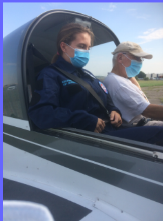
Au poste de commandes : check list avant décollage.

Tout le mois d'août et début septembre, les 24 juniors se sont initiés au pilotage : en double commande ou en solo, pour l'atterrissage ou le décollage, ils ont frôlé les nuages, apprécié les subtilités du vol à vue et la grande sensibilité des commandes de vol. Des sensations uniques, qu'on ne peut raconter si on ne l'a pas vécu soi-même. Alors quand allez-vous oser tenter l'expérience ? Leurs témoignages donnent envie !