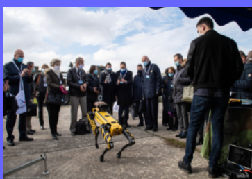
Robot d'emploi de l'Aae Technology