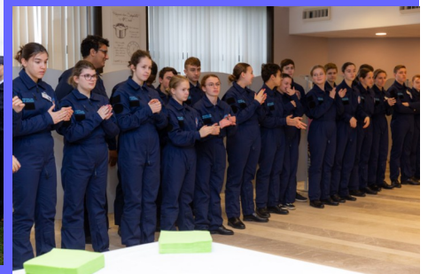
Les Juniors dans leur combinaison de vol applaudissent les lauréats des diplômes d'honneur et d'engagement remis lors de la galette des cadets.