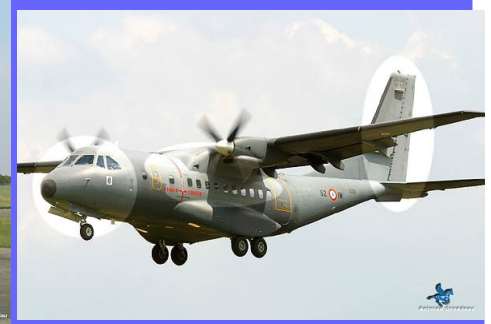
Casa CN 235

Deux appareils peuvent être assez facilement confondus : le Transall et le Casa CN235. Quels sont leurs points distinctifs ?