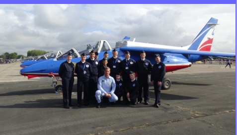
Avec le leader de la PAF (patrouille de France)